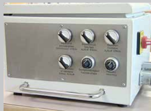
SBM Steuerbox manuell für manuelles Finishen von Einzelteilen und Kleinserien