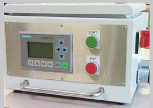
SBA Steuerbox automatik für zeitgesteuertes Einstichfinishen von Einzelteilen und Kleinserien